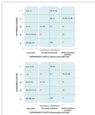
Figure 3: Regional governance regimes in Europe (preliminary).

Les quatre parties prenantes de l'analyse ciblée ReSSI—le Conseil de la ville de Coventry, la région de Danemark du sud, la région de Piedmont, le Conseil de la ville d'Oeiras—ont chargé l'équipe de recherche d'enquêter sur les possibilités pour les autorités locales d'implémenter les objectifs Europe 2020 dans un contexte d'évolution des systèmes de gouvernance et de planification territoriales.